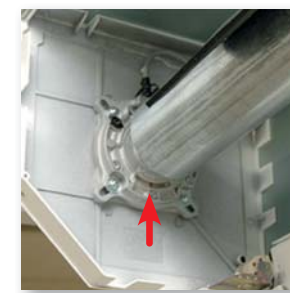
Vue intérieure du coffre

La détection d'obstacles protège également vos biens (vélos ...), éventuellement oubliés dans l'ouverture de la porte. Enfin, pour éviter toutes tentatives d'effraction, Novorol ® est équipée de verrous automatiques anti-soulèvement qui bloquent la porte en position fermée.