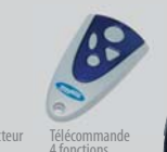
Télécommande 4 fonctions