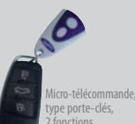
Micro-télécommande, type porte-clés, 2 fonctions