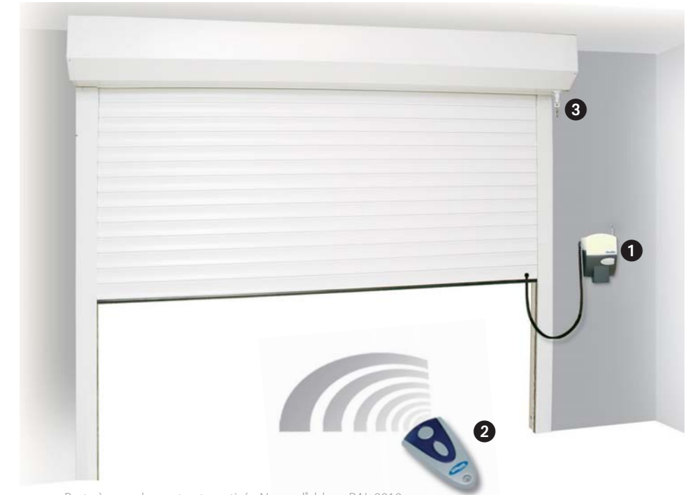
Porte à enroulement automatisée Novorol ® , blanc RAL 9010

Vous pouvez vous garer juste devant ou derrière la porte Novorol ® puisqu'elle ne déborde, ni à l'intérieur du garage, ni sur la voie, lors des manœuvres d'ouverture et de fermeture.